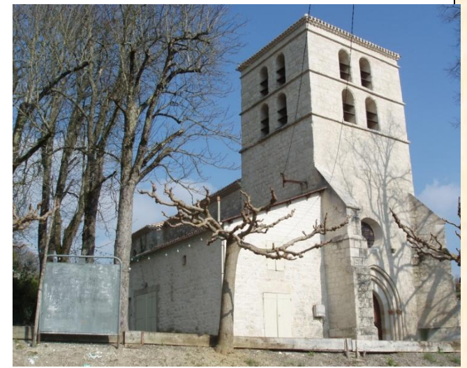
L'église de Tissac(P-J)