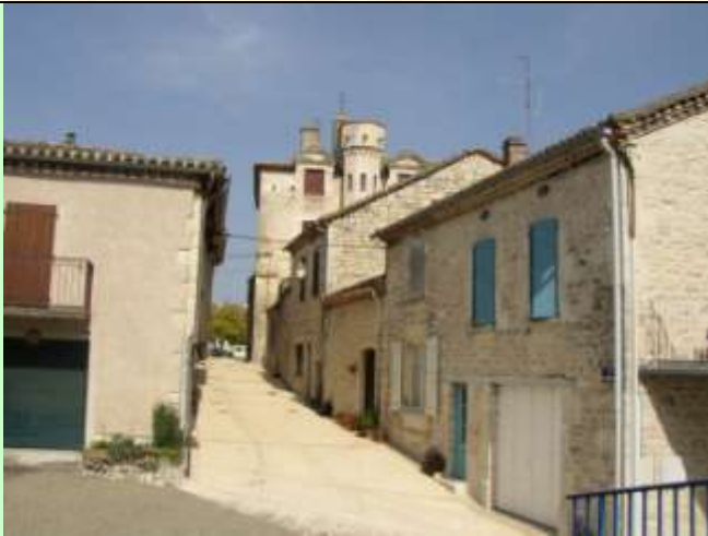
Le château et le reste du donjon du X IV e (PJ)

1820 hab (1990) 25 hab/km 2 superficie 72,8 km 2 Diocèse : Cahors - Sénéchaussée : Lauzerte Canton : Lauzerte