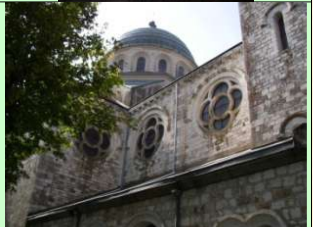
L'église Saint Martin (PJ)